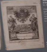
Annuncio della fabbrica di velluti di Biadene degli Isonzo - 1861/1928 Biadene degli Isonzo - 1861/1928