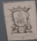
Annuncio della fabbrica di velluti di Biadene degli Isonzo - 1861/1928 Biadene degli Isonzo - 1861/1928

Il 1861 è l'anno di nascita della grande industria tessile italiana. In questo anno si fonda la S.p.A. di Alessandro Benetton, che dà il nome alla grande casa di moda che si svilupperà nel tempo. Benetton & C. S.p.A. nasce in un momento di grande fermento industriale e commerciale. La famiglia Benetton è una delle più importanti famiglie industriali italiane. La grande industria tessile italiana si sviluppa in questo periodo. Benetton & C. S.p.A. è una delle più importanti aziende italiane. La grande industria tessile italiana si sviluppa in questo periodo. Benetton & C. S.p.A. è una delle più importanti aziende italiane.