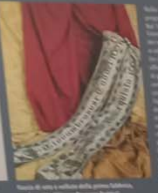
Bandiera della famiglia Benetton - 1861/1928 Benetton & C. S.p.A. - 1861/1928

Il 1861 è l'anno di nascita della grande industria tessile italiana. In questo anno si fonda la S.p.A. di Alessandro Benetton, che dà il nome alla grande casa di moda che si svilupperà nel tempo. Benetton & C. S.p.A. nasce in un momento di grande fermento industriale e commerciale. La famiglia Benetton è una delle più importanti famiglie industriali italiane. La grande industria tessile italiana si sviluppa in questo periodo. Benetton & C. S.p.A. è una delle più importanti aziende italiane. La grande industria tessile italiana si sviluppa in questo periodo. Benetton & C. S.p.A. è una delle più importanti aziende italiane.