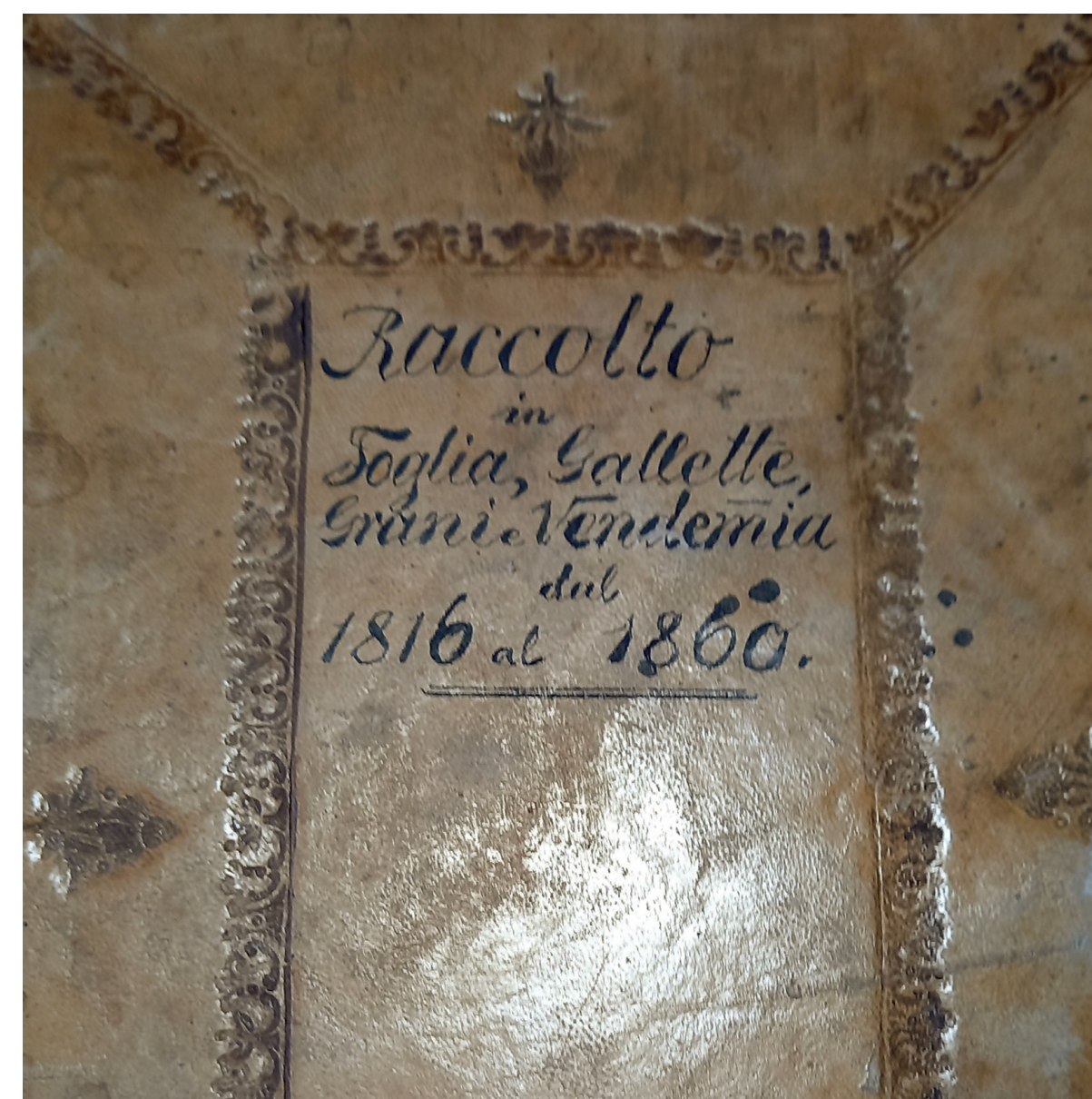
Registro gallette, 1816-1860

Nel 1825 compaiono le gallette "Brianza".