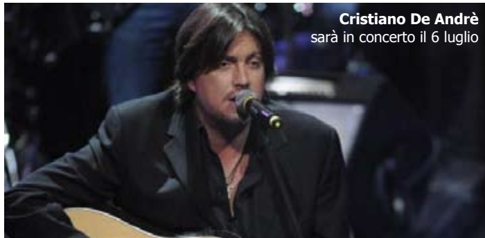
Cristiano De André sarà in concerto il 6 luglio

A cura della Schützenkompanie de Castelam